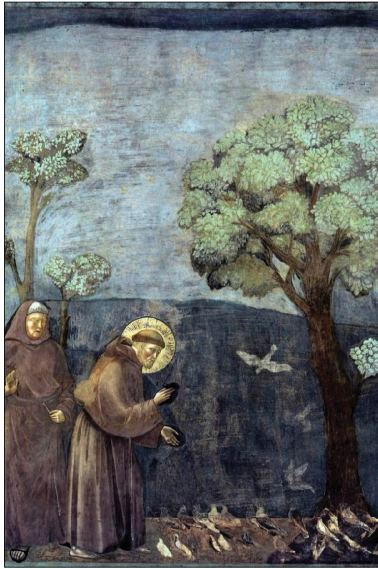
Giotto, «La predica di Francesco agli uccelli» (1290-1295 circa)

50. Possiamo cercare insieme la verità nel dialogo, nella conversazione pacata o nella discussione appassionata. È un cammino perseverante, fatto anche di silenzi e di sofferenze, capace di raccogliere con pazienza la vasta esperienza delle persone e dei popoli. Il cumulo opprimente di informazioni che ci inonda non equivale a maggior saggezza. La saggezza non si fabbrica con impazienti ricerche in internet, e non è una sommatoria di informazioni la cui veracità non è assicurata. In