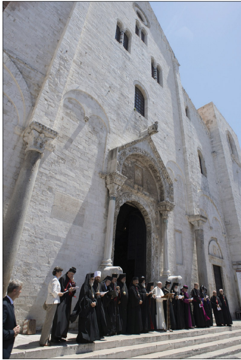
L'incontro a Bari con i capi delle Chiese e delle comunità cristiane del Medio Oriente (7 luglio 2018)

276. Per queste ragioni, benché la Chiesa rispetti l'autono-