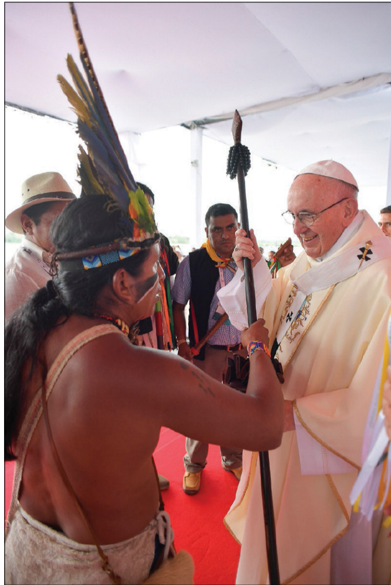
Messa a Villavicencio durante il viaggio apostolico in Colombia (8 settembre 2017)

145. C'è una falsa apertura all'universale, che deriva dalla