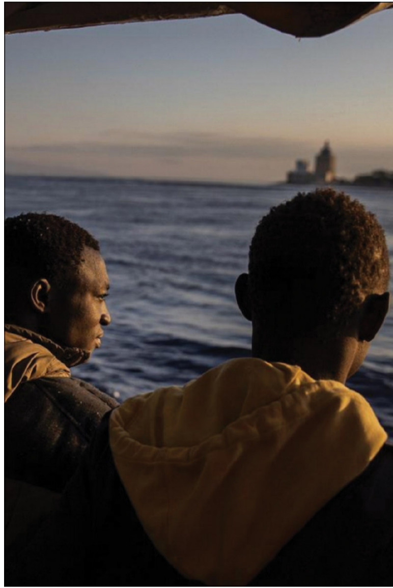
Migranti provenienti dalla Libia e salvati al largo della costa siciliana

126. Parliamo di una nuova rete nelle relazioni internazionali, perché non c'è modo di risolvere i gravi problemi del mondo ragionando solo in termini di aiuto reciproco tra individui o piccoli gruppi. Ricordiamo che «l'inequità non colpisce solo gli individui, ma Paesi interi, e obbliga a pensare ad un'etica delle relazioni internazionali». 105 E la giustizia esige di riconoscere e rispettare non solo i diritti individuali, ma anche i diritti sociali e i diritti dei popoli. 106 Quanto stiamo affermando implica che si assicuri il «fondamentale diritto dei popoli alla sussistenza ed al progresso» 107 che a volte risulta fortemente ostacolato dalla pressione derivante dal debito