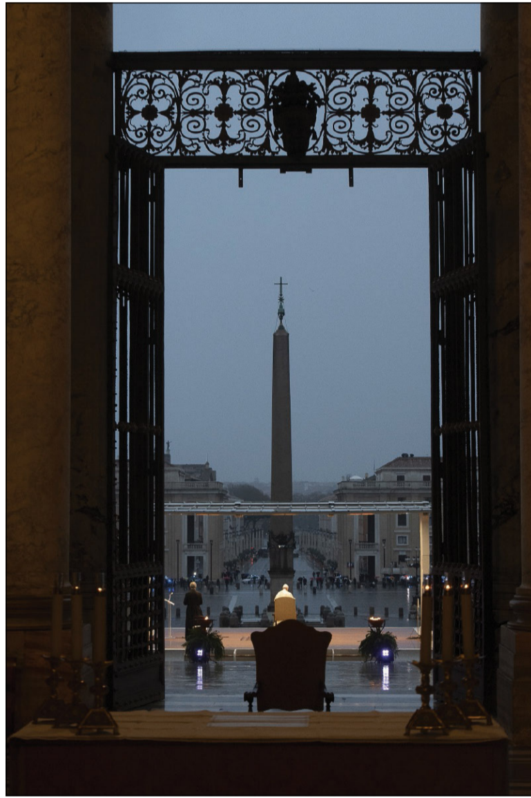
Il momento straordinario di preghiera in tempo di pandemia presieduto da Papa Francesco sul sagrato della basilica di San Pietro (27 marzo 2020)

29. Con il Grande Imam Ahmad Al-Tayyeb non ignoriamo gli sviluppi positivi avvenuti nella scienza, nella tecnologia, nella medicina, nell'industria e nel benessere, soprattutto nei Paesi sviluppati. Ciò nonostante, «sottolineiamo che, insieme a tali progressi storici, grandi e apprezzati, si verifica un deterioramento dell'etica, che condiziona l'agire internazionale, e un indebolimento dei valori spirituali e del senso di responsabilità. Tutto ciò contribuisce a diffondere una sensazione generale di frustrazione, di solitudine e di disperazione [...]. Nascono focolai di tensione e si accumulano armi e munizioni, in una situazione mondiale dominata dall'incertezza, dalla delusione e dalla paura del futuro e controllata dagli interessi economici miopi». Segnaliamo altresì «le forti crisi politiche, l'ingiustizia e la mancanza di una distribuzione equa delle risorse naturali. [...] Nei confronti di tali crisi che portano a morire di fame milioni di bambini, già ridotti a scheletri umani – a motivo della povertà e della fame –, regna un silenzio internazionale inaccettabile». 27 Davanti a questo panorama, benché ci