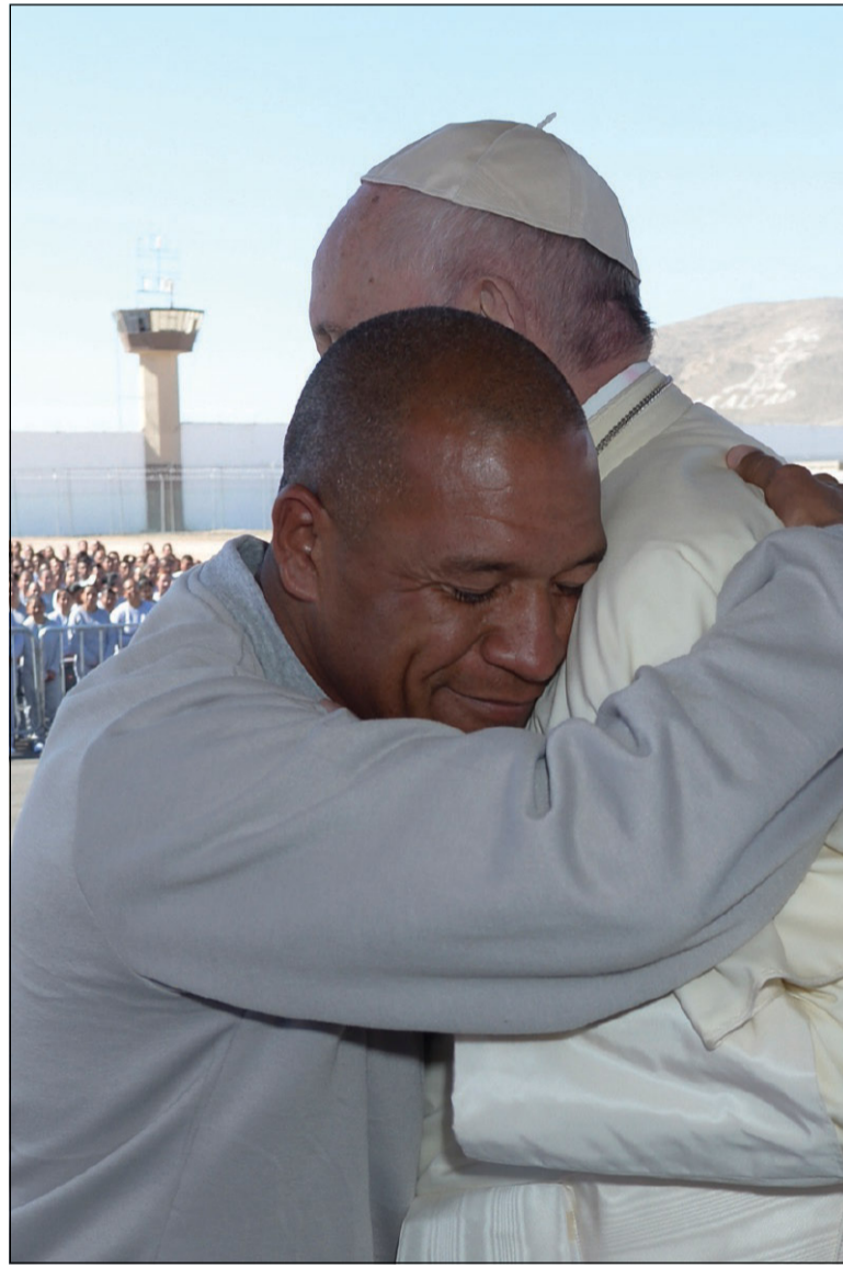
L'abbraccio con uno dei detenuti del penitenziario di Ciudad Juárez durante il viaggio apostolico in Messico (17 febbraio 2016)

258. È così che facilmente si opta per la guerra avanzando ogni tipo di scuse apparentemente umanitarie, difensive o preventive, ricorrendo anche alla manipolazione dell'informazione.