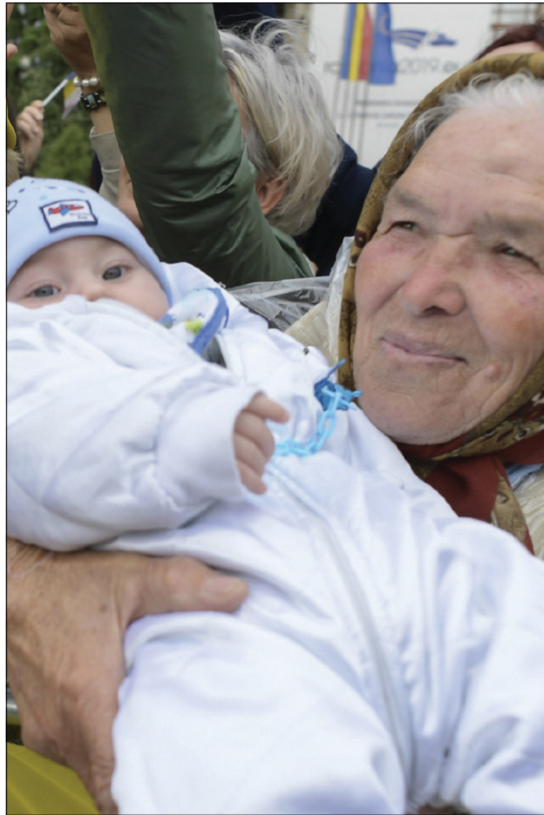
Una nonna mostra orgogliosa il nipotino a Papa Francesco durante l'incontro con i giovani e le famiglie a Iasi in Romania (1 giugno 2019)

107. Ogni essere umano ha diritto a vivere con dignità e a svilupparsi integralmente, e nessun Paese può negare tale diritto fondamentale. Ognuno lo possiede, anche se è poco ef-