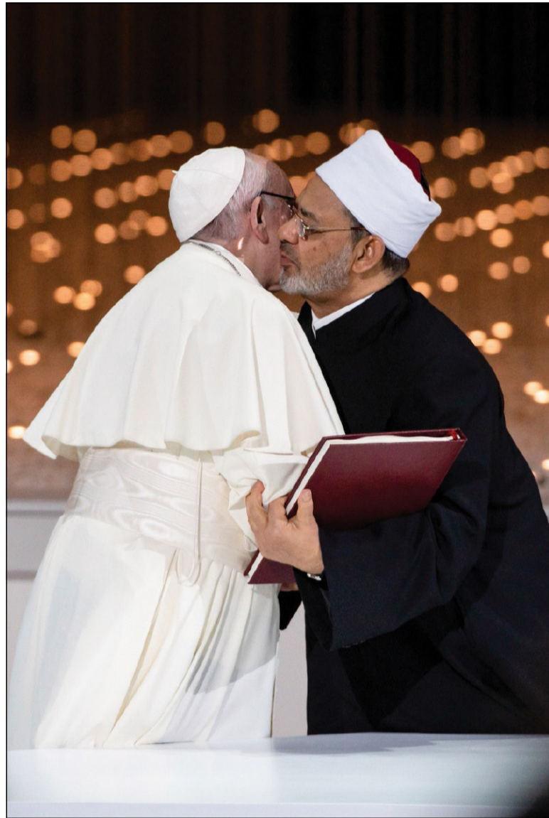
L'abbraccio con il Grande Imam Ahmad Al-Tayyeb dopo la firma del «Documento sulla fratellanza umana» (Abu Dhabi, 4 febbraio 2019)

12. «Aprirsi al mondo» è un'espressione che oggi è stata fatta propria dall'economia e dalla finanza. Si riferisce esclusivamente all'apertura agli interessi stranieri o alla libertà dei poteri economici di investire senza vincoli né complicazioni in tutti i Paesi. I conflitti locali e il disinteresse per il bene comune vengono strumentalizzati dall'economia globale per imporre un modello culturale unico. Tale cultura unifica il mondo ma divide le persone e le nazioni, perché «la società sempre