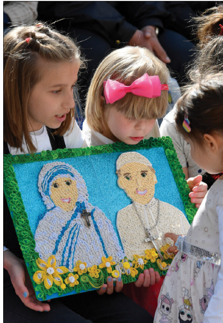
Un momento della visita di Francesco al Memoriale di Madre Teresa e dell'incontro con i poveri a Skopje durante il viaggio in Macedonia del Nord (7 maggio 2019)

182. Questa carità politica presuppone di aver maturato un senso sociale che supera ogni mentalità individualistica: «La carità sociale ci fa amare il bene comune e fa cercare effettivamente il bene di tutte le persone, considerate non solo individualmente, ma anche nella dimensione sociale che le unisce». 171 Ognuno è pienamente persona quando appartiene a un popolo, e al tempo stesso non c'è vero popolo senza rispetto per il volto di ogni persona. Popolo e persona sono termini correlativi. Tuttavia, oggi si pretende di ridurre le persone a individui, facilmente dominabili da poteri che mirano a interessi illeciti. La buona politica cerca vie di costruzione di comunità nei diversi livelli della vita sociale, in ordine a riequilibrare e riorientare la globalizzazione per evitare i suoi effetti disgreganti.