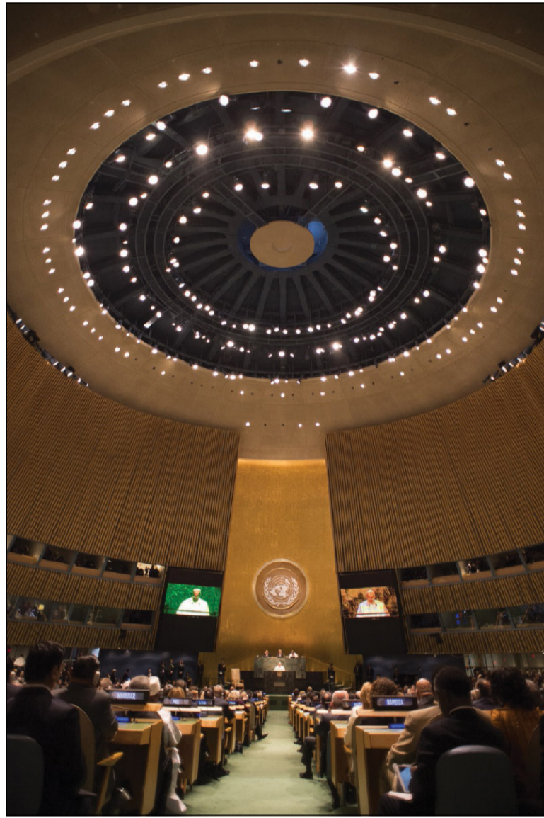
L'incontro a New York con i membri dell'Assemblea generale delle Nazioni Unite (25 settembre 2015)

165. La vera carità è capace di includere tutto questo nella sua dedizione, e se deve esprimersi nell'incontro da persona a persona, è anche in grado di giungere a un fratello e a una sorella lontani e persino ignorati, attraverso le varie risorse che le istituzioni di una società organizzata, libera e creativa sono capaci di generare. Nel caso specifico, anche il buon samaritano ha avuto bisogno che ci fosse una locanda che gli permettesse di risolvere quello che lui da solo in quel momento non era in condizione di assicurare. L'amore al prossimo è realista e non disperde niente che sia necessario per una trasformazione della storia orientata a beneficio degli ultimi. Per altro verso, a volte si hanno ideologie di sinistra o dottrine sociali unite ad abitudini individualistiche e procedimenti inefficaci che arrivano solo a pochi. Nel frattempo, la moltitudine degli abban-