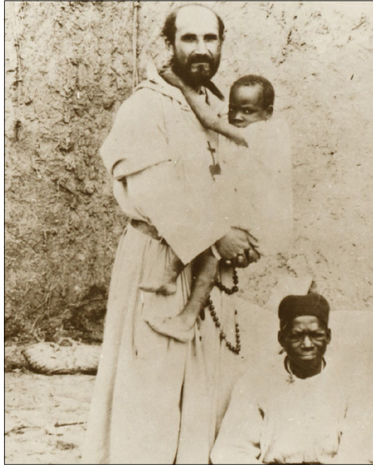
Il beato Charles de Foucauld

287. Egli andò orientando il suo ideale di una dedizione totale a Dio verso un'identificazione con gli ultimi, abbandonati nel profondo del deserto africano. In quel contesto esprimeva la sua aspirazione a sentire qualunque essere umano come un