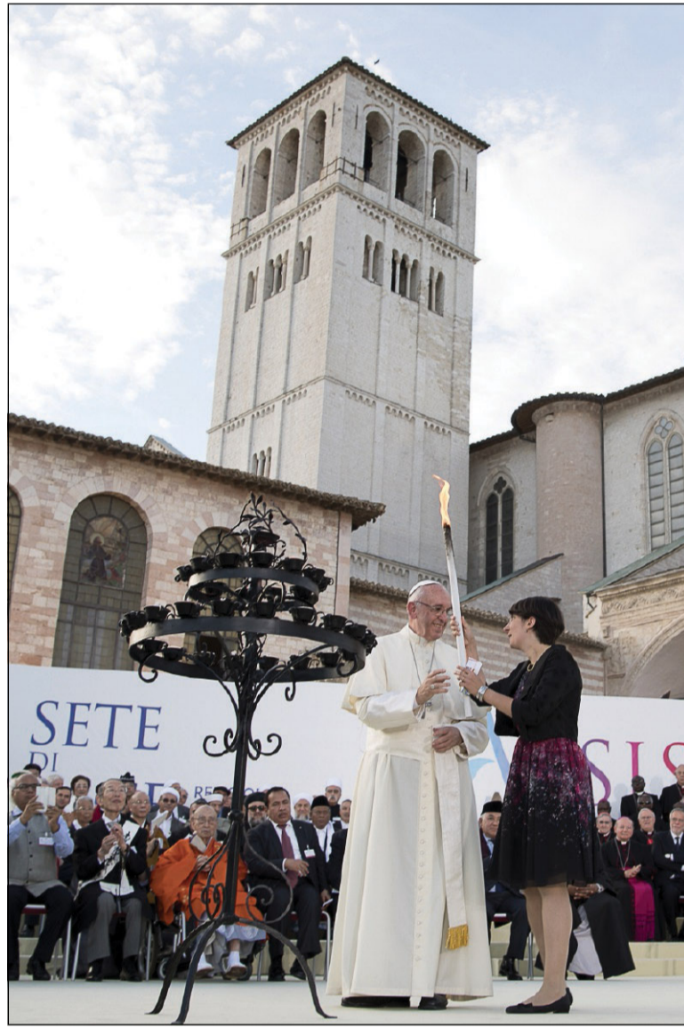
La Giornata mondiale di preghiera per la pace tenutasi ad Assisi sul tema «Sete di pace. Religioni e culture in dialogo» (20 settembre 2016)

219. Quando una parte della società pretende di godere di tutto ciò che il mondo offre, come se i poveri non esistessero, questo a un certo punto ha le sue conseguenze. Ignorare l'esistenza e i diritti degli altri, prima o poi provoca qualche forma di violenza, molte volte inaspettata. I sogni della libertà, dell'uguaglianza e della fraternità possono restare al livello delle mere formalità, perché non sono effettivamente per tutti. Pertanto, non si tratta solamente di cercare un incontro tra coloro che detengono varie forme di potere economico, politico o accademico. Un incontro sociale reale pone in un vero dia-