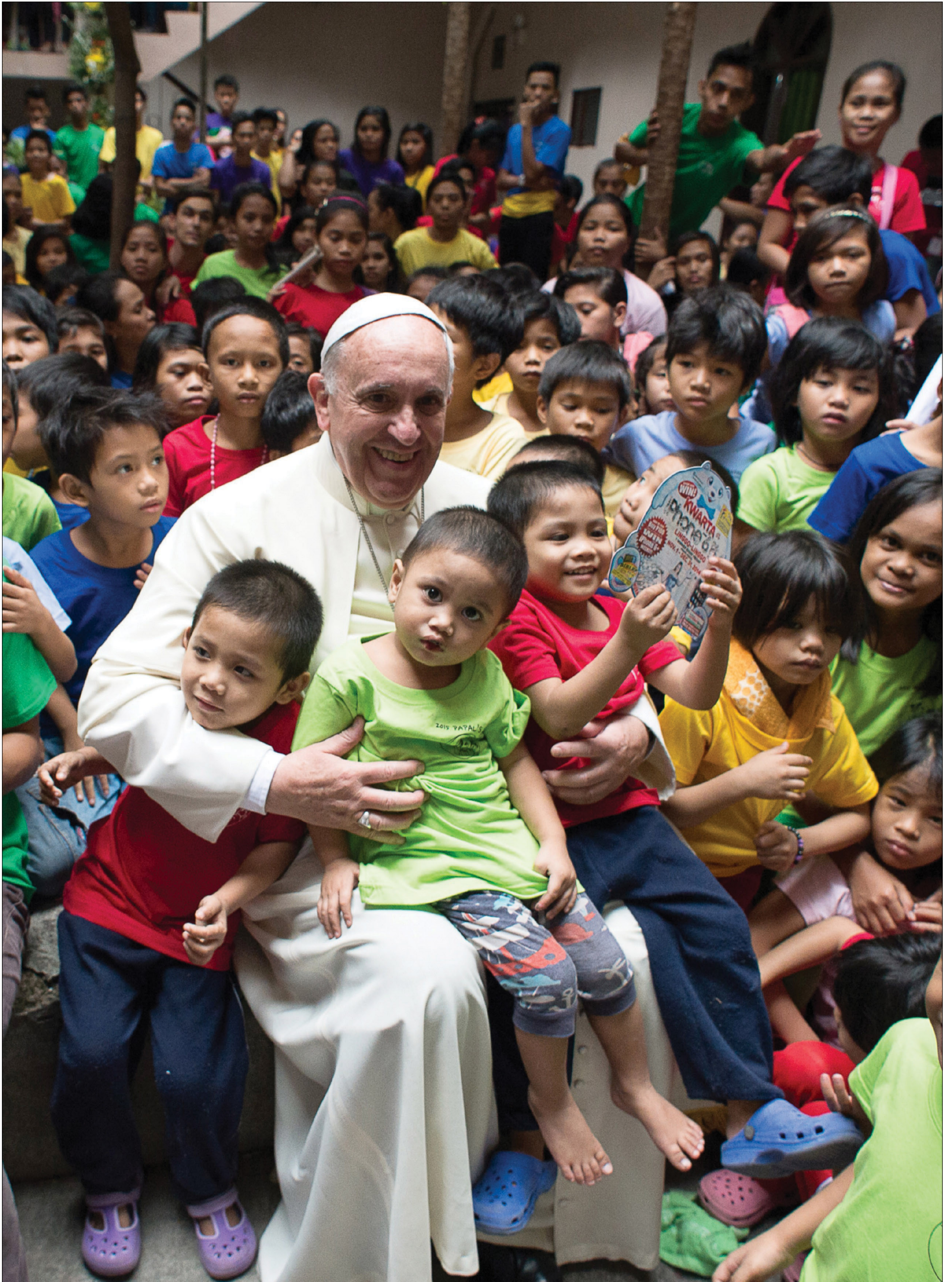
Francesco con i bambini della fondazione Anak-Tuk a Manila (16 gennaio 2015)