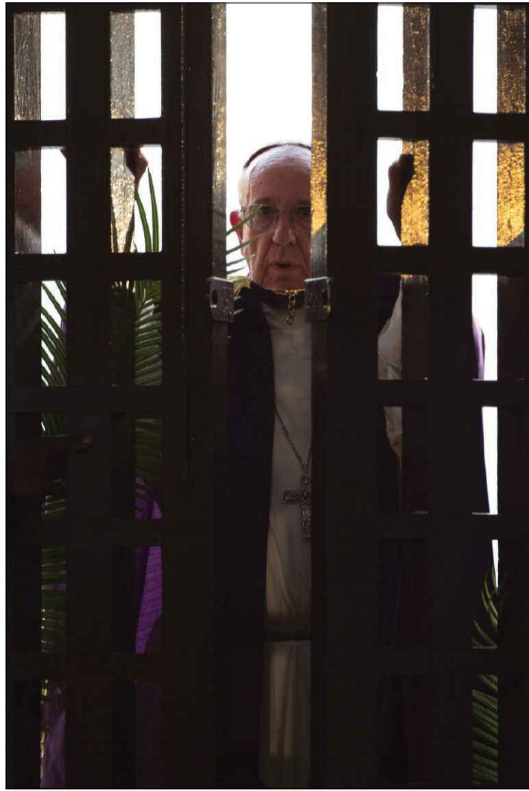
Apertura della Porta santa nella cattedrale di Bangui per l'inizio del Giubileo straordinario della misericordia (29 novembre 2015)

86. A volte mi rattrista il fatto che, pur dotata di tali motivazioni, la Chiesa ha avuto bisogno di tanto tempo per condannare con forza la schiavitù e diverse forme di violenza. Oggi, con lo sviluppo della spiritualità e della teologia, non abbiamo scuse. Tuttavia, ci sono ancora coloro che ritengono di sentirsi incoraggiati o almeno autorizzati dalla loro fede a sostenere varie forme di nazionalismo chiuso e violento, atteggiamenti xenofobi, disprezzo e persino maltrattamenti verso coloro che sono diversi. La fede, con l'umanesimo che ispira, deve mantenere vivo un senso critico davanti a queste tendenze e aiutare a reagire rapidamente quando cominciano a insinuarsi. Perciò è importante che la catechesi e la predicazione includano in modo più diretto e chiaro il senso sociale dell'esistenza, la dimensione fraterna della spiritualità, la convinzione sull'inalienabile dignità di ogni persona e le motivazioni per amare e accogliere tutti.