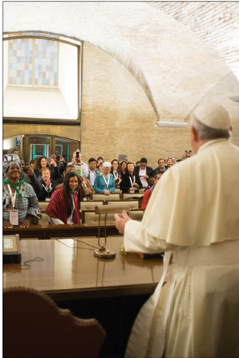
Nell'Aula Vecchia del Sinodo in Vaticano il primo incontro mondiale dei Movimenti popolari (28 ottobre 2014)

201. La risonante diffusione di fatti e richiami nei media, in realtà chiude spesso le possibilità del dialogo, perché permette che ciascuno, con la scusa degli errori altrui, mantenga intatti e senza sfumature le idee, gli interessi e le scelte propri. Predomina l'abitudine di screditare rapidamente l'avversario, at-