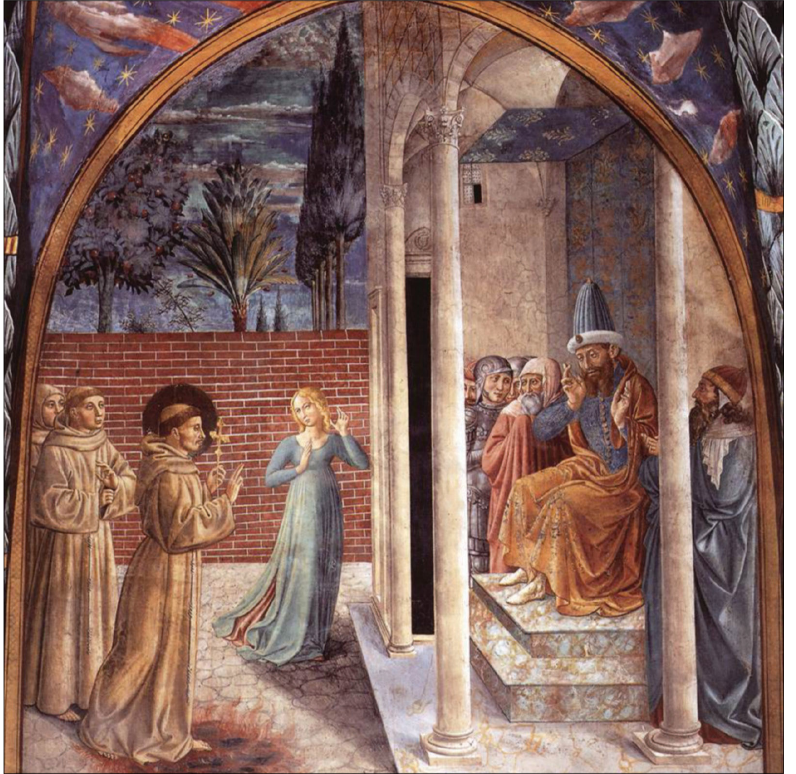
Benozzo Gozzoli «Francesco e il Sultano Malik-al-Kamil» (1450-1452)