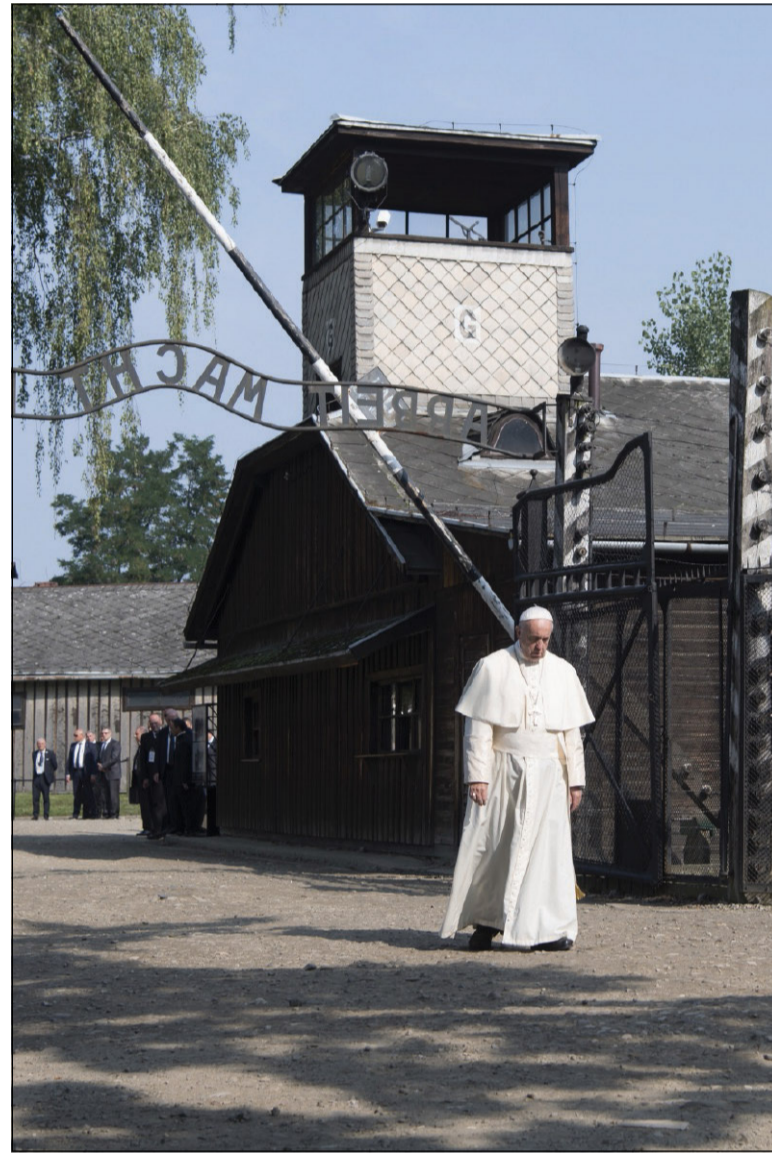
Papa Francesco ad Auschwitz durante il viaggio apostolico in Polonia (29 luglio 2016)

236. Alcuni preferiscono non parlare di riconciliazione, perché ritengono che il conflitto, la violenza e le fratture fanno parte del funzionamento normale di una società. Di fatto, in qualunque gruppo umano ci sono lotte di potere più o meno sottili tra vari settori. Altri sostengono che ammettere il perdono equivale a cedere il proprio spazio perché altri dominino la situazione. Perciò ritengono che sia meglio mantenere un gioco di potere che permetta di sostenere un equilibrio di forze tra i diversi gruppi. Altri credono che la riconciliazione sia una cosa da deboli, che non sono capaci di un dialogo fino in fondo e perciò scelgono di sfuggire ai problemi nascondendo le ingiustizie: incapaci di affrontare i problemi, preferiscono una pace apparente.